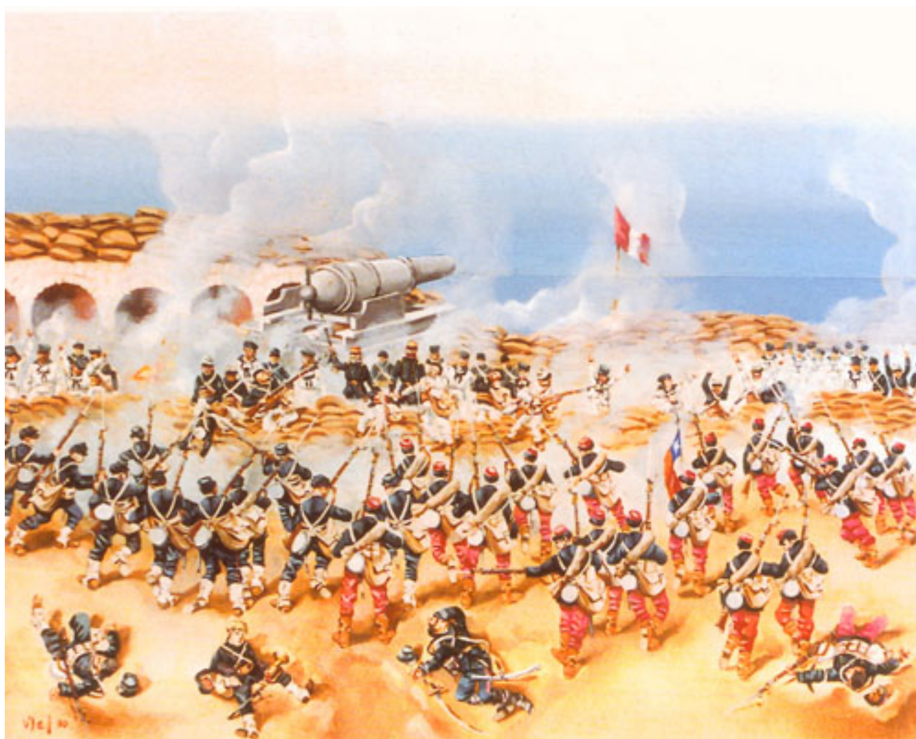
TOMA DEL MORRO DE ARICA