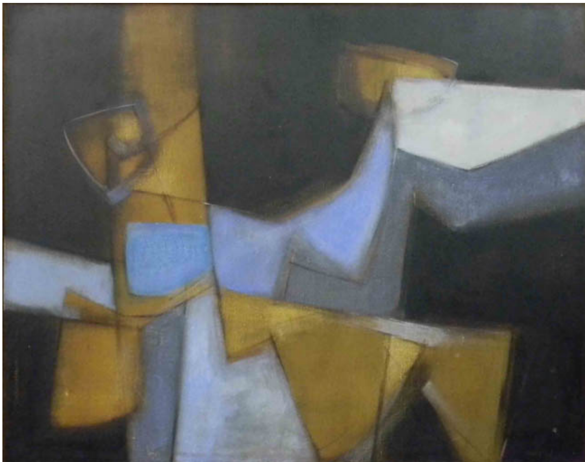
ESTRUCTURA EN AZUL